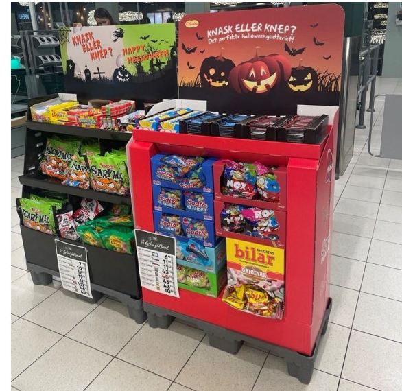
Eksempel på spesialutstilling